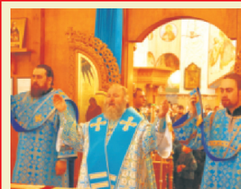
Святая Четыредесятница в Сургутском благочинии 2-3 стр.