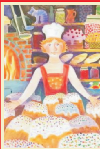
Помощник пекаря стр. 7