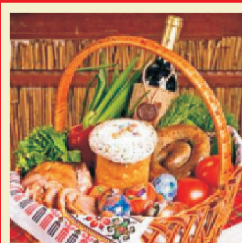
Что можно и что нельзя на Пасху 5 стр.