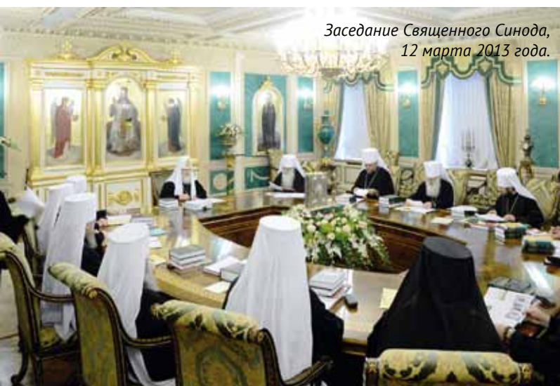
Заседание Священного Синода, 12 марта 2013 года.

409 ПРИХОДОВ И 39 МОНАСТЫРЕЙ В СОСТАВЕ РУССКОЙ ЗАРУБЕЖНОЙ ЦЕРКВИ.