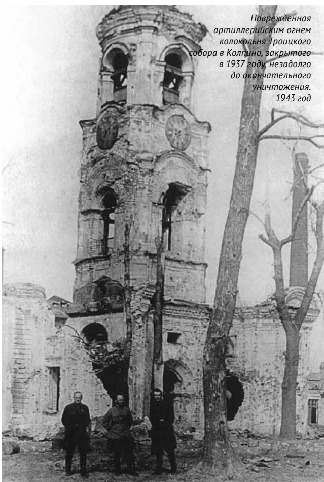
Поврежденная артиллерийским огнем колокольня Троицкого собора в Колпино, закрытого в 1937 году, незадолго до окончательного уничтожения. 1943 год

Активно участвовали священнослужители и в партизанском движении. Священники укрывали отставших при отступлении от частей красноармейцев, сбежавших из лагерей военнопленных, вели патриотическую агитацию среди