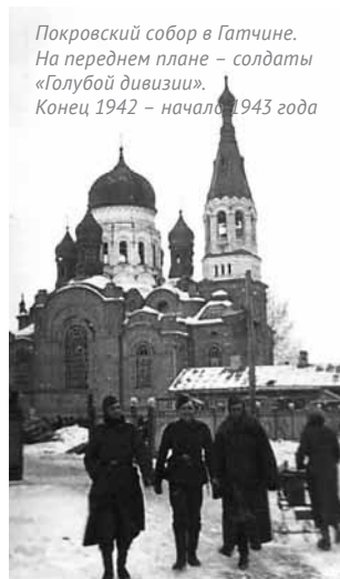
Покровский собор в Гатчине. На переднем плане – солдаты «Голубой дивизии». Конец 1942 – начало 1943 года