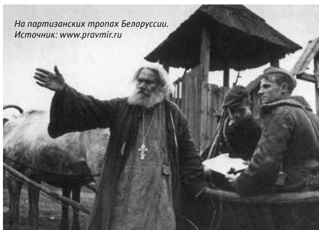
На партизанских тропах Белоруссии.

Материальная помощь государству и Красной Армии в целом стала одним из самых важных направлений патриотического служения духовенства и верующих в период войны. Несмотря на законодательный запрет заниматься благотворительностью и отсутствие собственного счета в банке, Русская православная церковь внесла немалый мате-