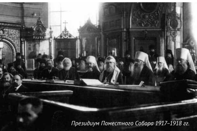
Президиум Поместного Собора 1917–1918 гг.

года патриаршества патриарха Кирилла число архиереев увеличилось примерно на треть – сегодня их около 300. Работа собора начинается с доклада патриарха – это всегда самая полная (в том числе и статистическая) информация о состоянии дел в церкви. На заседаниях, кроме архиереев и узкого круга сотрудников