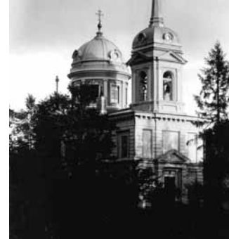
В апреле 1943 года в Царской Славянке возобновлены богослужения в Екатерининской церкви, закрытой в 1938 году

ская Германия обрушила на советский народ. Уже в первый год войны стало ясно, что без веры в Бога, которая есть суть русского духа, и без православной церкви, как особой организации духовной жизни русского человека, эту войну не выиграть. Это хорошо понимал и Сталин. Тем более, что, согласно последней переписи населения 1937 года, несмотря на все гонения, две трети сельского и одна треть городского населения СССР по-прежнему считали себя верующими.