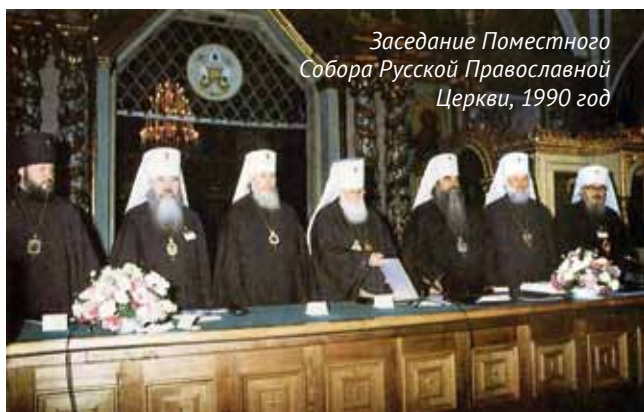
Заседание Поместного Собора Русской Православной Церкви, 1990 год