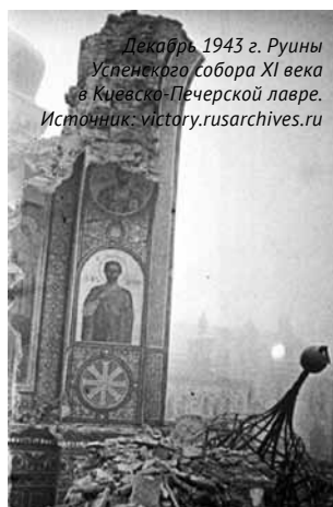
Декабрь, 1943 г. Руины Успенского собора XI века в Киевско-Печерской лавре.