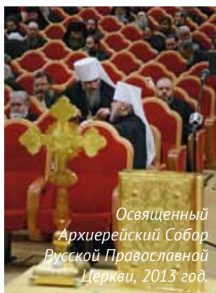
Освященный Архиерейский Собор Русской Православной Церкви, 2013 год.

года патриаршества патриарха Кирилла число архиереев увеличилось примерно на треть – сегодня их около 300. Работа собора начинается с доклада патриарха – это всегда самая полная (в том числе и статистическая) информация о состоянии дел в церкви. На заседаниях, кроме архиереев и узкого круга сотрудников