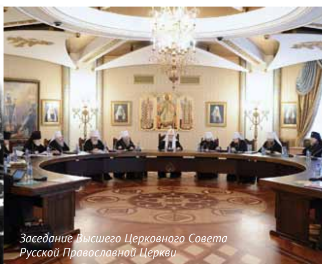
Заседание Высшего Церковного Совета Русской Православной Церкви

Поместным собором называется, чтобы отличить его от Вселенского, на котором должны собираться делегаты от всех шестнадцати православных церквей мира для решения общеправославных вопросов (однако Вселенский собор не проводился с XIV века). Считалось (и было закреплено в уставе церкви), что именно поместным соборам принадлежит высшая власть в РПЦ, фактически же за прошедшее столетие собор созывался только для