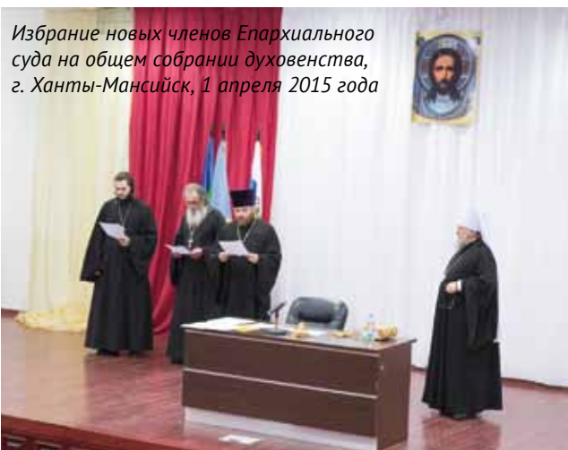
Избрание новых членов Епархиального суда на общем собрании духовенства, г. Ханты-Мансийск, 1 апреля 2015 года

славной Церкви, суд Архиерейского Собора (высшей инстанции) с юрисдикцией в пределах Русской Православной Церкви. Разбирательство дел во всех церковных судах закрытое. Членом епархиального суда может быть только пресвитер. Председатель суда является викарным архие-