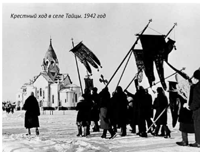
Крестный ход в селе Тайцы. 1942 год

ЗНАМЕНИТОЕ ОБРАЩЕНИЕ 3 ИЮЛЯ 1941 ГОДА СТАЛИН НАЧАЛ ИМЕННО СО СЛОВ «БРАТЯ И СЕСТРЫ». ТАК ОБРАЩАЛИСЬ К ПРИХОЖАНАМ ПРАВОСЛАВНЫЕ СВЯЩЕННИКИ. ЭТИМИ СЛОВАМИ СТАЛИН ПОДЧЕРКНУЛ ЕДИНСТВО РУССКИХ В БОРЬБЕ ПРОТИВ ФАШИСТСКИХ ЗАХВАТЧИКОВ. НАЧАЛАСЬ ВЕЛИКАЯ ОТЕЧЕСТВЕННАЯ ВОЙНА, ВО ВРЕМЯ КОТОРОЙ МНОГОЕ БЫЛО ПЕРЕОЦЕНЕНО. ПОБЕДИТЬ В НЕЙ БЕЗ ИСКОННО РУССКИХ УБЕЖДЕНИЙ БЫЛО НЕВОЗМОЖНО – И СТАЛИН ЭТО ОСОЗНАВАЛ.