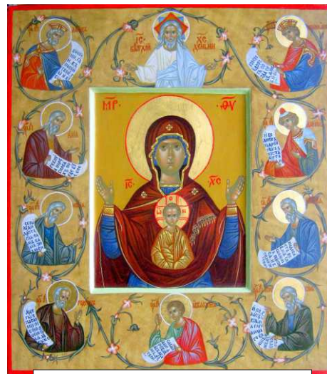
Икона «Знамение» Курская

чудо. Как только охотник поднял святую икону с земли, тотчас на месте, где лежала икона, с силой забил источник чистой воды. Это произошло 8 сентября 1295 года. Охотник не решился оставить икону в лесу и построил на месте обретения небольшую деревянную часовню, и в ней поставил новояв-