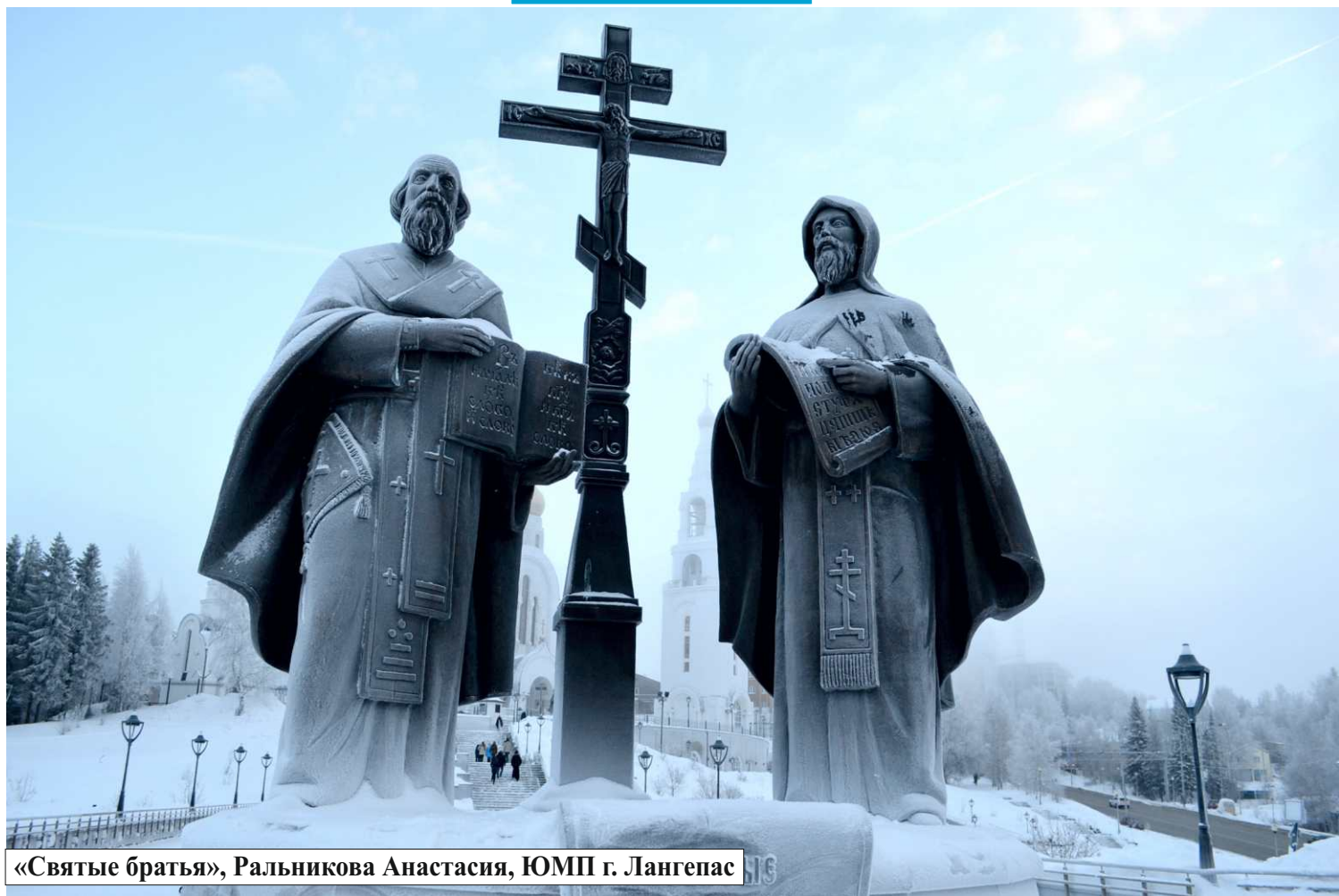
«Святые братья», Ральникова Анастасия, ЮМП г. Лангепас